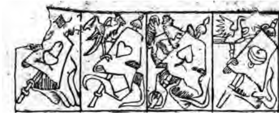
Bannerkarten aus dem sogenannten „Münchener-Kindl-Bogen“, um 1530

ten des Ulm-Münchner Typs noch keinen Platz hatte, wohl auch nicht notwendig war, weil Rang und Wert der Bannerkarte allgemein bekannt waren, finden wir später auf aufwändigeren Bannerkarten, nämlich das römische Zahlenzeichen „X“ (Zehn) über oder in dem Banner.