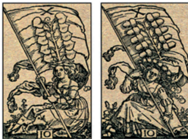
Banner-Zehner des H. S. Beham aus Nürnberg um 1530

Offensichtlich wurden die Zehnerkarten aus Gewohnheit weiterhin als „Banner“ bezeichnet, obwohl weit und breit kein solches mehr auf den Karten zu finden war. Der aufmerksame Leser wird es nun schon ahnen: Vom „Banner“ zum „Bahner“ ist es nicht weit!