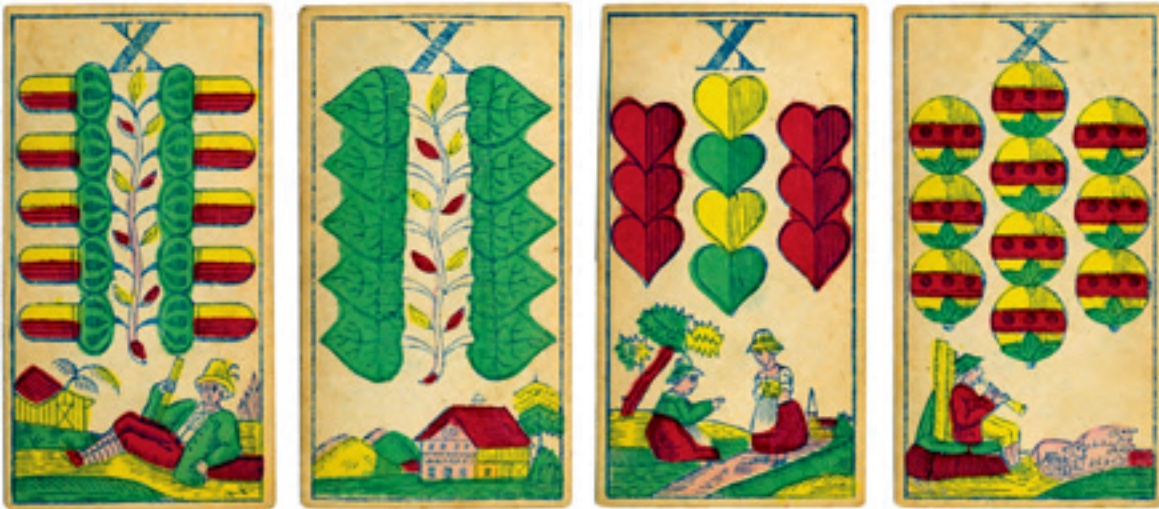
Die Zehner im Bayerischen Bild um 1870

Wer selber Karten spielt oder einmal längere Zeit eingefleischten Schafkopfern oder Wattern zugehört hat, kennt die Lust der Spieler zur Verballhornung von Wörtern und Begriffen. Ist es da ein Wunder, dass man aus dem „Banner“, mit dem man nichts mehr verbinden konnte, mit dem Aufkommen der modernen Transportmittel den „Bahner“ gemacht hat, den „Eisenbahner“ halt. Aus dem Schellen-Banner wird der Schellen-Bahner, wird der Schellen-Eisenbahner. So einfach ist das manchmal. Man muss es nur wissen!