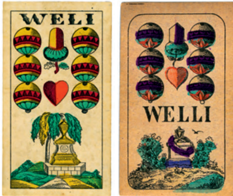
Ein „Weli“ aus dem Salzburger Kartenbild und ein „Welli“ aus einem Tiroler Kartenbild