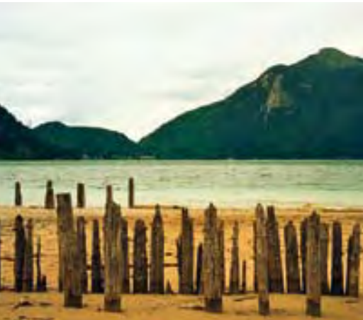
400 Jahre alte Holzpfähle für Fischzuchtanlagen des Klosters Benediktbeuern