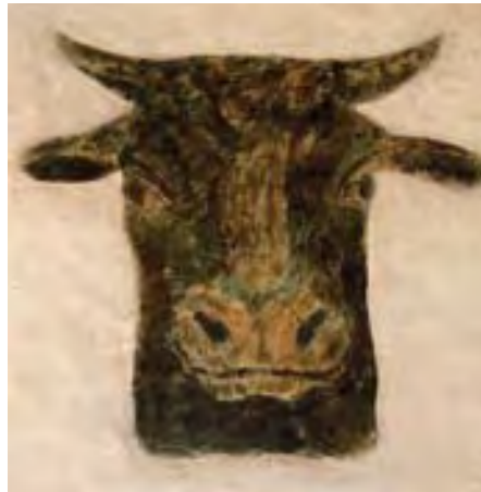
Die Staffelalm, beliebter Sommeraufenthalt des Malers Franz Marc