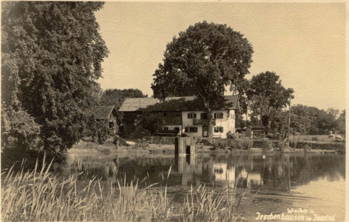
Dorfweiher in Irschenhausen. Postkarte 1935

Das Dorf Irschenhausen zahlte den „Zehnten“ ebenso wie Icking an das Kloster Schäftlarn. Das galt auch für die bereits im Kapitel „Das Dorf Icking“ erwähnte Schweinezinssteuer. In den Zehent-Zinsverzeichnissen des Jahres 1313 ist angegeben, was „Ursenhausen“ damals als „Zehent“ zu leisten hatte: die vier großen Höfe je ein Drittel der Getreideernte, 100 Eier, zehn Käse, eine Schale Rüben und Hülsenfrüchte sowie 30 Denare (römische Silbermünzen); die vier kleinen Höfe des Dorfes ein Drittel ihrer Getreideernte, sowie 50 Eier und fünf Käse. 284 Die großen Höfe waren um die Kirche angeordnet, von den kleinen Höfen lag einer auf dem Weg nach „Morlpach“ und einer auf dem Weg nach „Wanelhausen“. Daneben gab es den Hof Chirchmair und den Hof des Webers: „item manssum Chirchmair, item manssum textoris“ 285 Die 1140 geweihte kleine Dorfkirche fiel 1632 den Brandschatzungen der Schweden zum Opfer. Sie wurde bis auf die Grundmauern zerstört. Zu Ende des Dreißigjährigen Krieges erhielt die Gemeinde eine neue St. Anianus geweihte Kirche. Möglicherweise handelte es sich ursprünglich um eine gotische Chorturmkirche. Die spätgotische Kirche wurde im 18. Jahrhundert barockisiert, ihre gotische Spitzhaube wich einer Zwiebelhaube.