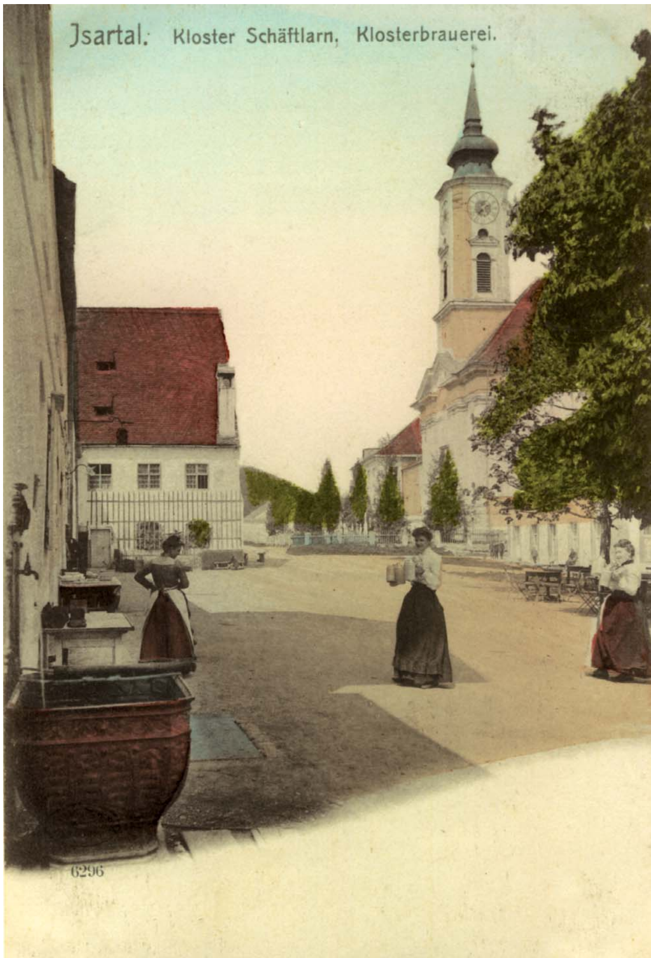
Jsartal: Kloster Schäftlarn, Klosterbrauerei.