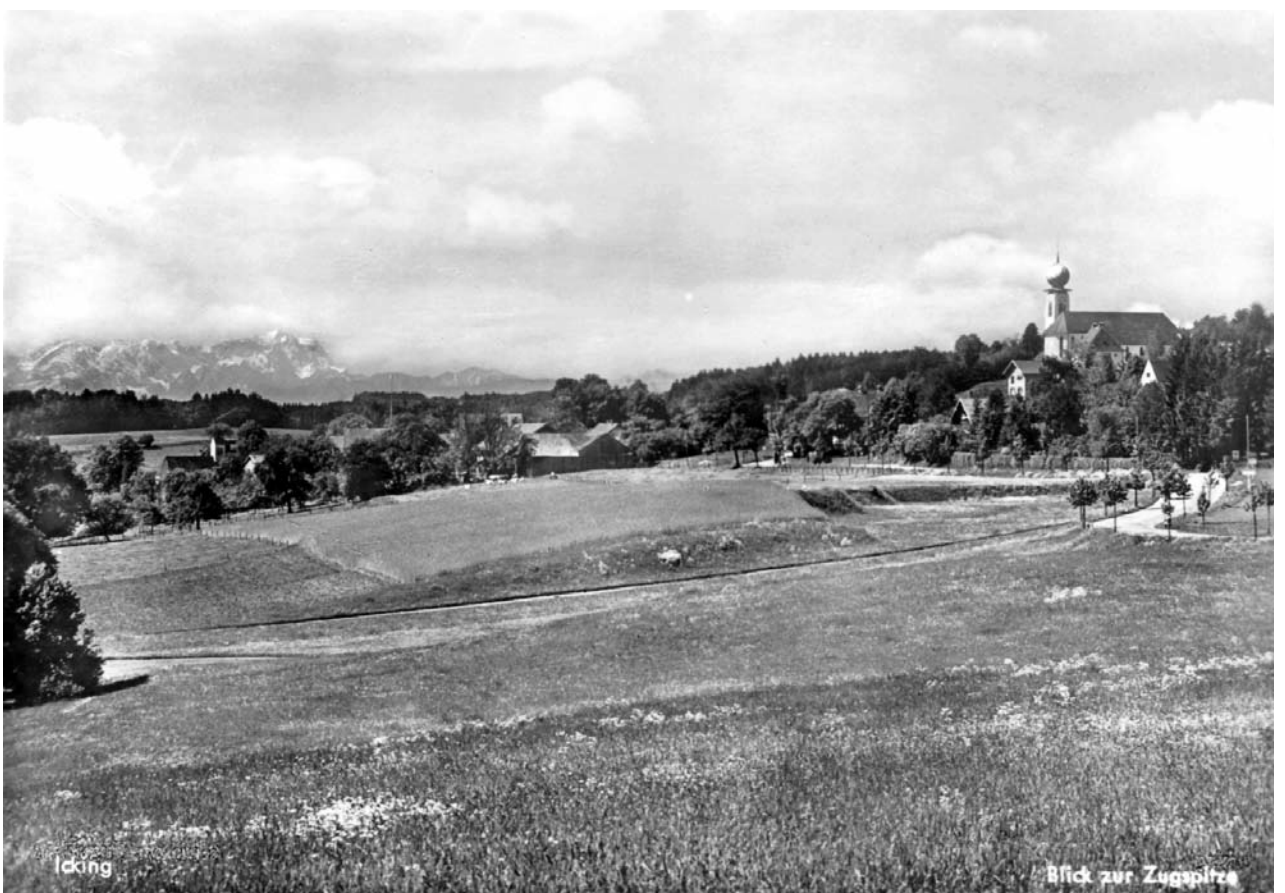
Icking von Norden, in der Bildmitte der Rothenhof. Postkarte um 1950